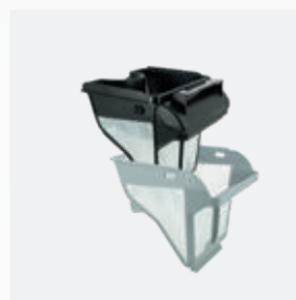
Bac filtrant Filtre double niveau : 150/60 µ