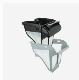
Bac filtrant Filtre double niveau : 150/60 µ