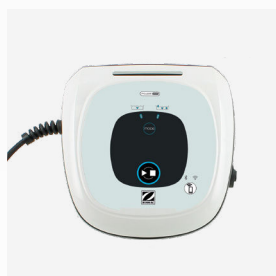
Boîtier de commande