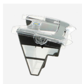
Bac filtrant (3L)