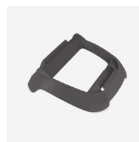
Socle pour boîtier de commande