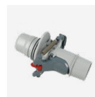
Vanne de réglage automatique de débit (skimmer)