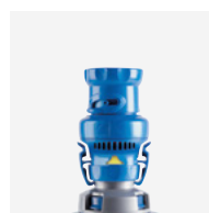
Régulateur de débit (robot)