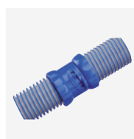
Tuyaux Twist Lock