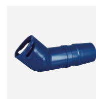
Coude 45° allongé rotatif