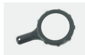
Clé desserrage cellule