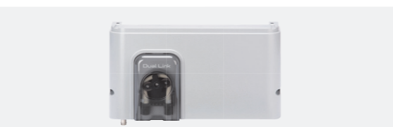
Module Dual Link (Régulation pH et Redox)