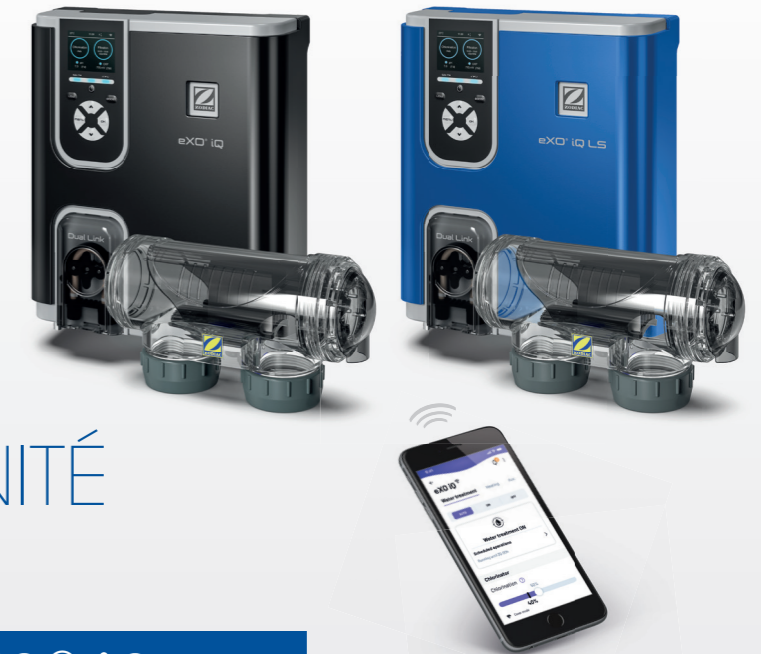
Modèles présentés avec les modules de régulation pH en option