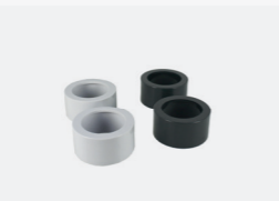
Kit réducteurs à coller