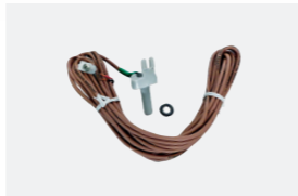
Kit sonde de température