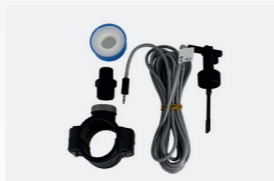
Kit détecteur de débit