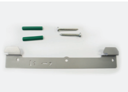
Kit fixation murale