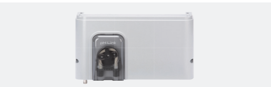
Module pH Link (Régulation pH)